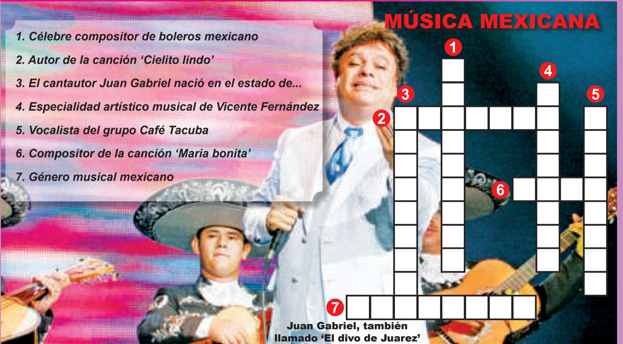
Juan Gabriel, también llamado 'El divo de Juarez'